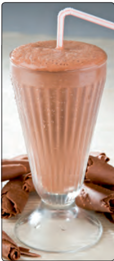
Mehrmals täglich einen Protein-Drink mixen.