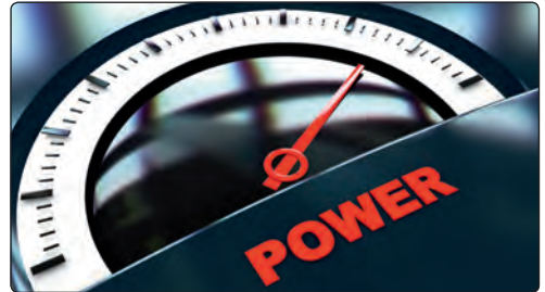
Volle Power während der Diät. Goldfield macht's möglich.

Sportler können sich einen Abfall ihrer Energiekurve auch beim Abnehmen nicht erlauben. Dabei kommt einem Überschuss an Protein in der Nahrung eine Schlüsselrolle zu. Ein Protein-Drink – PlantoStar oder WheyStar – reduziert das Hungergefühl, kurbelt die Fettverbrennung an und verhindert ein Absinken des Blutzuckerspiegels. Ganz wichtig! Denn der geht immer einher mit einem sofortigen Abfall der Leistungskurve.