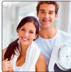
Vitale Menschen haben mehr Spaß am Leben.