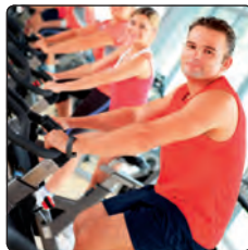
Aktivität kurbelt den Stoffwechsel an.